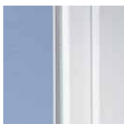
Klassisches Design mit weicher Kontur

Mit modernen Kunststofffenstern aus VEKA Profilen gewinnt jedes Haus. Denn das klassische Design des SOFTLINE Systems mit der leicht abgerundeten Kontur ist zeitlos und harmonisiert hervorragend mit unterschiedlichsten Architekturstilen – ob modern oder traditionell, ob Neubau oder Renovierung.