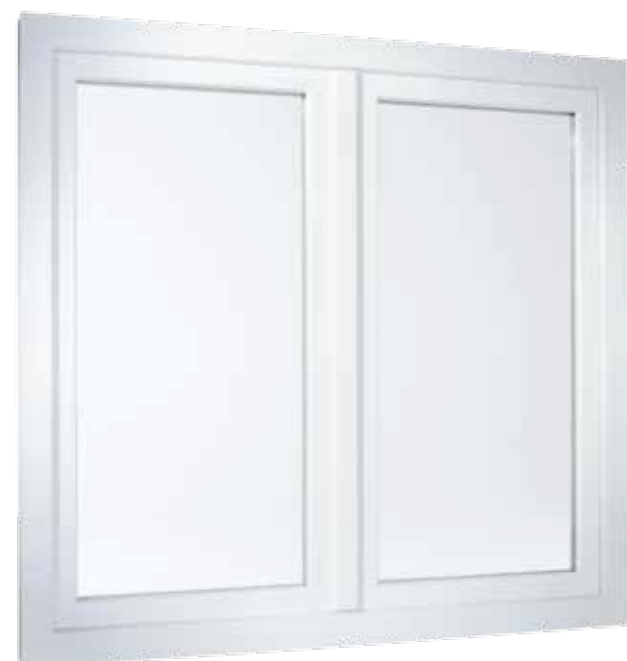
2-flügeliges Fenster in flächenversetzter Variante